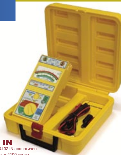
2732 IN конструктив 4132 IN аналогичен другим моделям 4100 серии.